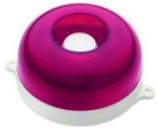
МАЯК-12-КП, МАЯК-24-КП оповещатель комбинированный