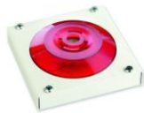
МАЯК-220-КПМ1-НИ оповещатель комбинированный, металлический корпус, наружное исполнение