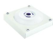
МАЯК-220-ЗМ1-НИ оповещатель звуковой, металлический корпус, наружное исполнение