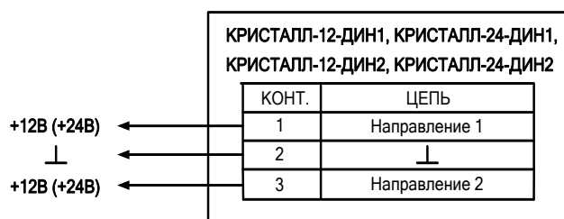
Рис. 1. Схема подключения

3.2. Подключение изделий должно выполняться в соответствии со схемой (рис. 1.).