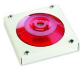
МАЯК-220-КПМ1-НИ оповещатель комбинированный, металлический корпус, наружное исполнение